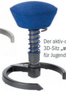
Der aktiv-dynamische 3D-Sitz „swopper“ für Jugendliche und Erwachsene.