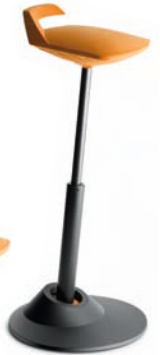
Der VarioSitz „muvman“ für gesünderes Arbeiten an höhenverstellbaren Schreibtischen und Steh-/Sitz-Arbeitsplätzen.